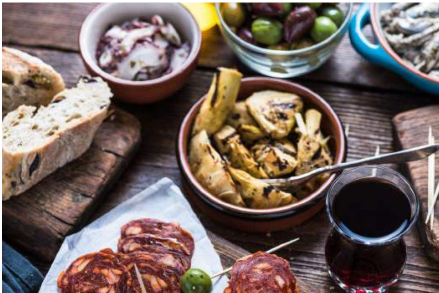
TABLA MALLORQUINA — Un pedacito de Mallorca en la mesa

La Tabla Mallorquina es un tradicional menú de tapas que lleva a la mesa la diversidad culinaria mallorquina y española. Disfrute de una selección de especialidades típicas, servidas plato a plato al estilo familiar.